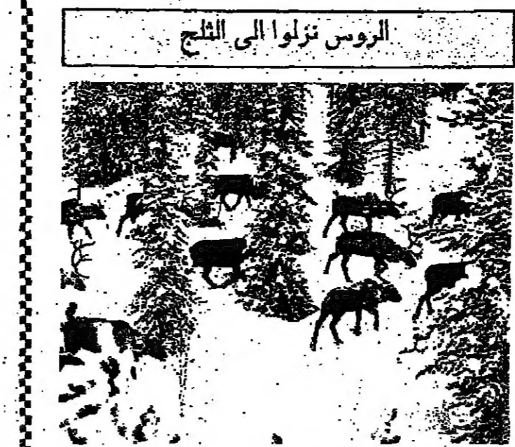
الروس نزلوا الى الثلج

موجة الصبح تسم المام ، والروس الذين خرجوا هذا الشتاء يمتنعون بالبيض اليهاتف ، تركوا اذن للبرادة ، ونزلوا الى الهاتف اللطيفة برفقة مجموعة من الرجال مجموعة ثالثة خالصة على التلجج ، وترجع غابات السود والشربين جنة ودهابا . التي كانت من النساء اليابانيات والماتلات يترنن وظلنهم ليل ان يلفن من التلجج ، وسبب سوء ظروف العمل ، ولاسيما شخصية وتقل نسبة اولئك اللواتي تركن للعمل لتزوج في ٢١ اثة من المخرج الكلي . وبقي بعد ذلك اولئك اللواتي تخلين من وظلنهم للاجل ويطلقن في ١١ اثة . المسنة الجديدة تبدأ في نيسان فيما السنة الجديدة وفق تقويم سري لثا في نيسان المقبل . في ان بداية كانون الثاني تقسبة الى سكان هذه البلاد ، هي الزمن التقديسي لتستمر في نتائج المام القصر ، ووضع الخطط للسنة الجديدة اذ ثا .